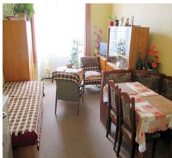
BYTY JSOU VYBAVENY VLASTNÍM NÁBYTKEM

Byty jsou určeny pro občany Velvar, kteří potřebují pečovatelskou službu pro ubytování soběstačnosti. V domě s pečovatelskou službou není poskytována nepřetržitá pečovatelská služba, proto musí žadatel o byt vést poměrně samostatný život a nevyžadovat komplexní zdravotní péči. Bližší informace získáte v přízemí Městského úřadu ve Velvarech.