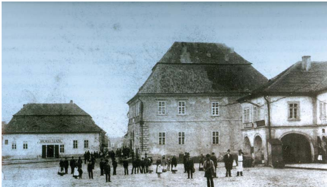
Hostince Reduta a U zlaté hvězdy kolem roku 1880.