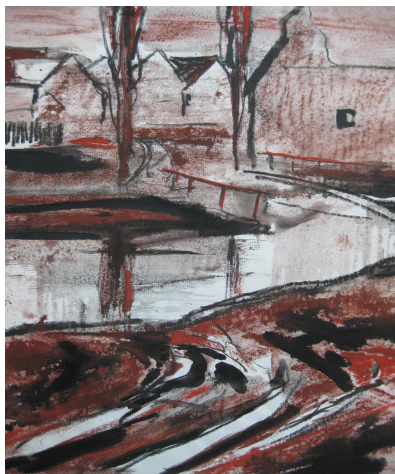
Bláto v Ješíně