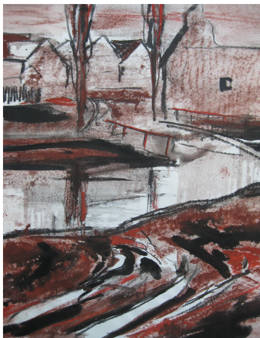
Bláto v Ješíně, 1965

MĚSTSKÉ MUZEUM VELVARY připravuje na srpen VÝSTAVU