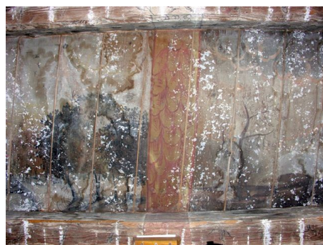
Iluzivní malba průvlakových trámů

Co tedy vlastně na nástropní malbě vidíme? Rozlehlá krajina se střídá s pohledy na hrady, tvrze, či města, která se nepravidelně objevují na pahorcích, případně v blízkosti jezera, končící pohledem na moře s loďstvem a opevněným městem na vysoké skále. V krajině se objevují postavy, tu osamělé, tu ve dvojicích či trojicích, v rozdílném barvě oděvu a v různých pozicích. Na obloze poletují ptáci, na špičce stavby jednoho z měst si čáp udělal hnízdo, druhý létá mezi oblaky.