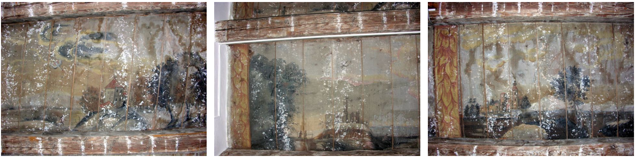
Detaily krajiny s tvrzí a městy

Zkoumáme-li jednotlivé figury pozorněji, nemůžeme si nevšimnout, že každá má nějaký nástroj, který nápadně připomíná zbraň, ať již pušku s bodáky přes rameno či šavli zavěšenou u pasu. Některé postavy mají na hlavách třírohé klobouky, jiné klobouk s pérem nebo vysokou čepici. Zcela nepochybně jsou tyto postavy oblečené ve vojenských kabátech, v krátkých kalhotách s dlouhými punčochami - postavy na můstku svými svrchními kabáty s dlouhými šosy připomínají šlechtické důstojníky. Vojáci krácejí krajinou, jeden se shýbá k rybníku či jezeru, další je podle postoje a držení zbraně na stráži.