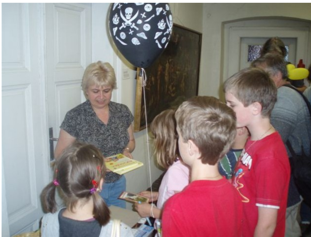
Muzejní noc 2011 – odměny soutěžícím