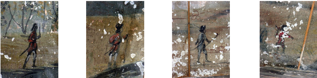
Detaily jednotlivých figur v krajině

Zkoumáme-li jednotlivé figury pozorněji, nemůžeme si nevšimnout, že každá má nějaký nástroj, který nápadně připomíná zbraň, ať již pušku s bodáky přes rameno či šavli zavěšenou u pasu. Některé postavy mají na hlavách třírohé klobouky, jiné klobouk s pérem nebo vysokou čepici. Zcela nepochybně jsou tyto postavy oblečené ve vojenských kabátech, v krátkých kalhotách s dlouhými punčochami - postavy na můstku svými svrchními kabáty s dlouhými šosy připomínají šlechtické důstojníky. Vojáci krácejí krajinou, jeden se shýbá k rybníku či jezeru, další je podle postoje a držení zbraně na stráži.