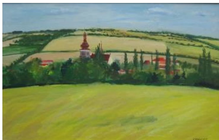
Velvary od křížku