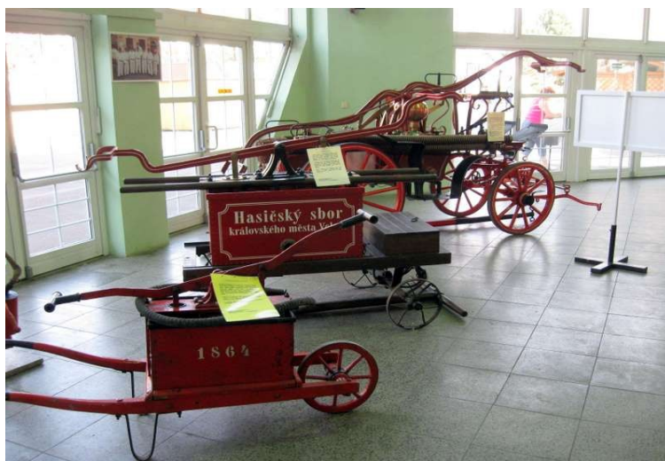
historická technika SDH Velvary