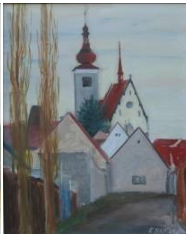
Kostel sv. Kateřiny od západu