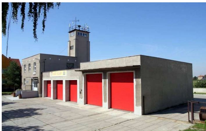
Budova hasičské zbrojnice po I. etapě oprav.