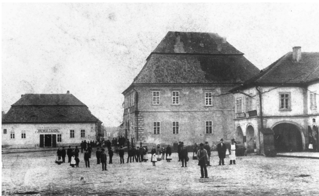
Hostinec Reduta a U Zlaté hvězdy, kolem roku 1880.