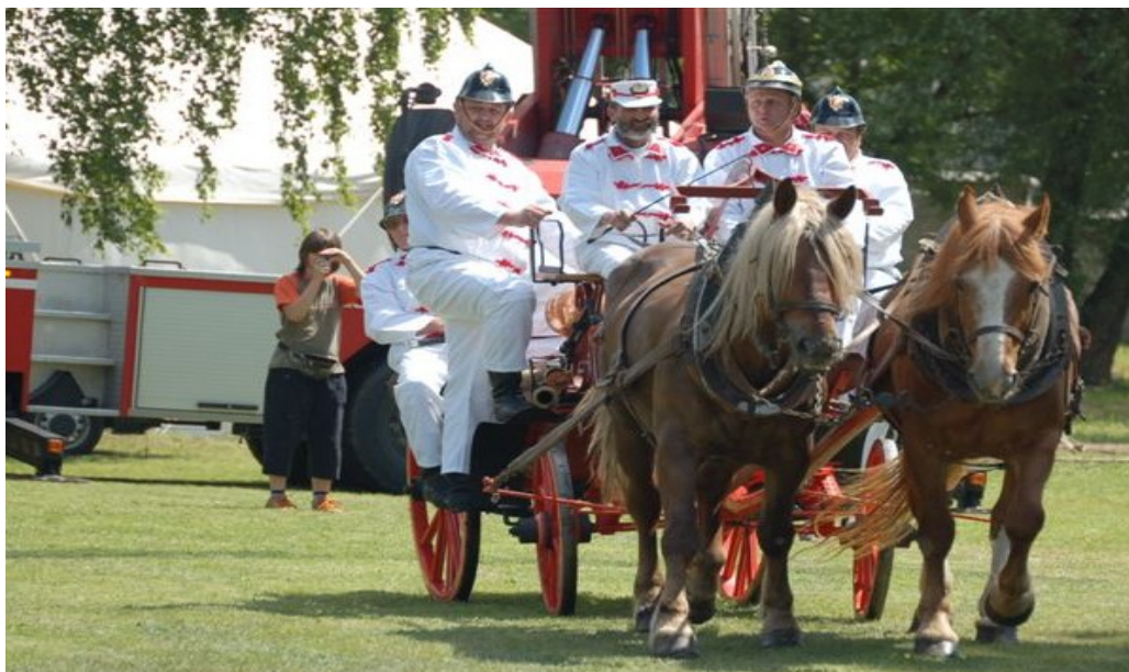
Fotografie z průběhu oslav na: www.velvary.cz , www.sdh.velvary.com