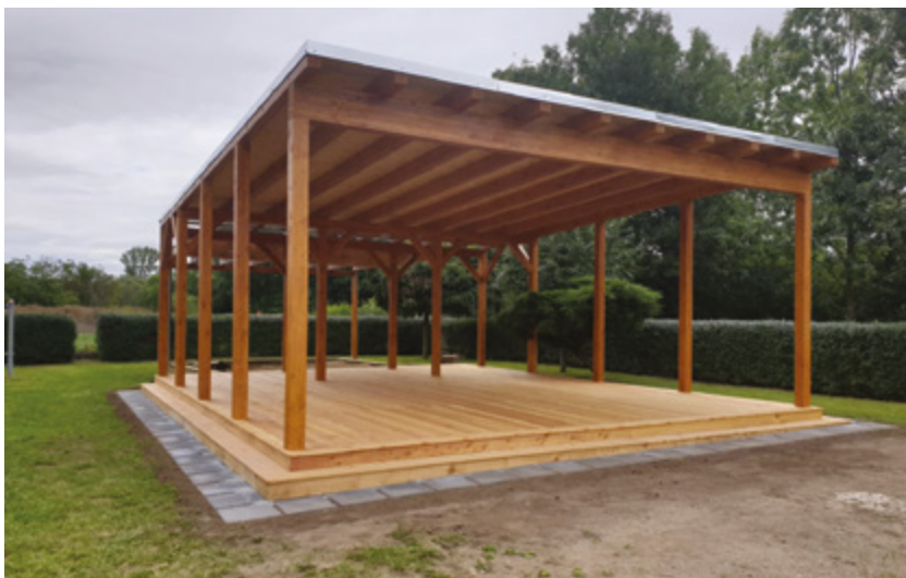
Nový altán v MŠ Velvary byl hrazen právě z prostředku fishe 6 PRV - město se i v lednu bude ucházet o další prostředky.

Budou rozděleny do tří „fichí“ – část pro zemědělské podnikatele (fiche 2), část pro nezemědělské podnikatele (fiche 4) a zřejmě největší díl, minimálně 15 milionů, pro obce a další žadatele ve fichi 6.