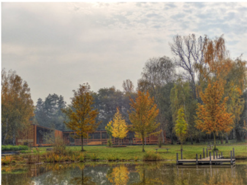
Učko se uložilo k zimnímu spánku

akcí, koncertů, tancovaček, vystoupení a projekcí, konaly se tu i besedy, přednášky, školní třídní schůzky i venkovní jednání zastupitelstva (jak se nám tenhle objekt hodil v době, kdy jsme se nesměli scházet uvnitř!) a dokonce i svatby. Velmi se osvědčilo i komunitní občerstvovací okénko, z nějž o všechny pečoval s láskou pan správce. Dík patří nejen jemu, ale Vám všem! A co těší nejvíc je, že U-čko po své první sezóně vypadá stejně krásně jako na začátku, všichni se k němu chovali pěkně,