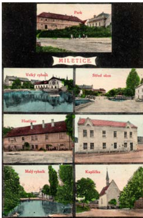
Miletice na počátku 20. st.