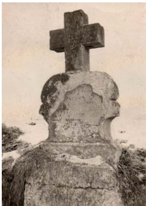
Kříž ve 40. letech 20. století

ben, jak to u rychtářů bývalo, svoji rodinu měl rád. Nepřál si, aby žena a děti zůstaly nezaopatřeny, kdyby zemřel. Rozhodl se ženě ukázat místo, kde poklad leží. Vzal kolečko, jako by jel na pole, ale v tom se objevila hraběnka, která se přišla zeptat, zda by bylo možno nějak pomoci dvěma zadluženým sedlákům, jimž půjčila před časem i své vlastní peníze. Rychtář, jenž ve vesnici nebyl oblíben patrně i pro svoji lakotu, odpověděl: „Ne, těm se to musí prodat!“ Asi myslel i na to, jak výhodně by mohl jejich statky koupit. Hraběnka rychtáře tedy vyzvala, aby s ní jel do Velvar na úřad a ten již nemohl ukázat manželce, kde je poklad uložen. Po jejich odjezdu zazlival na návsi shromážděný dav vesničanů rychtáři příkré jednání a mnozí jej odsuzovali. Pár jedinců za ním dokonce zahrozilo pěstí slovy: „Aby tě krev zalila, rychtáři!“