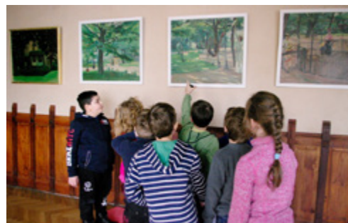
foto z programu Nebojte se obrazů, Městské muzeum Velvary