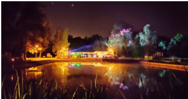
Letní party probarvila Malvaňák