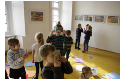
foto z programu Barvy se houpu na vlnách, Galerie T. Vosolsobě, Velvary