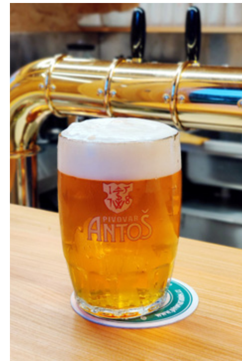
A docela se snaží!