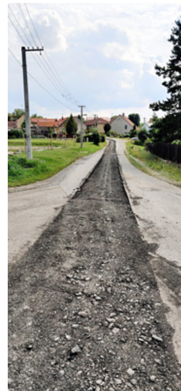
Velká Bučina – červenec 2020