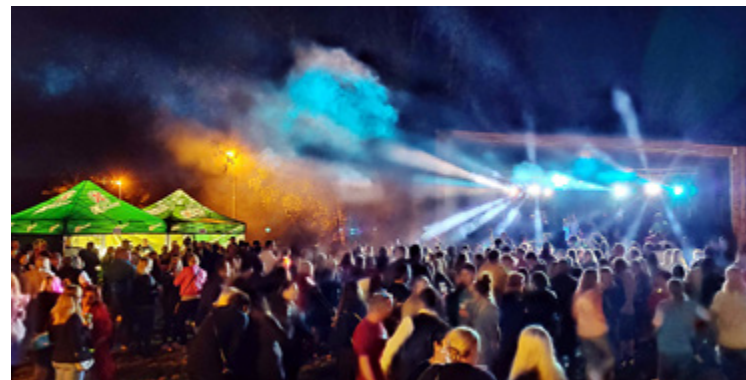
Na letní party bylo plno

časové kapacity a zároveň míra zatížení – nechceme, aby se místo stalo neúnosně hlučným pro okolní obyvatele i přírodu, proto počet větších akcí kontrolujeme a omezujeme. Těší nás, že se nám podařilo otevřít okénko komunitní občerstvovny, odkud pan správce v době setkávání komunity nabízí drobné občerstvení. Prosím, vězte, že se nejedná o běžný bufet ani restauraci, veškerý výnos z prodeje je použit na provoz komunitního centra. Město totiž – protože na výstavbu objektu získalo dotaci – nesmí Učko komerčně pronajímat. Proto jsme rádi, že jsme našli cestu, jak nabídnout dobré pivo, nanuk a limonádu. Otevřeno bude po celou sezónu až do října. Místo nemá pravidelnou otevírací dobu, je otevřeno při spolkových akcích a dále příležitostně dle potřeby a zájmu. Však se zajděte podívat!