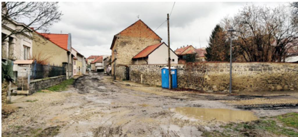
Najdi 10 rozdílů

V tomto případě to bylo bezmála 5 let. Rok se připravovala dokumentace, v dalším roce se musela obnovit kanalizace, aby nový povrch nemusel být brzy rozkopáván, poté se dva roky čekalo na ČEZ, než přeloží své vedení do země, a teprve pak se mohlo začít dláždit. Výsledek ale stojí za to. Snažíme se, aby se brzy dočkali lidé i v dalších lokalitách, kde svůj chodník již déle vyhlízejí.