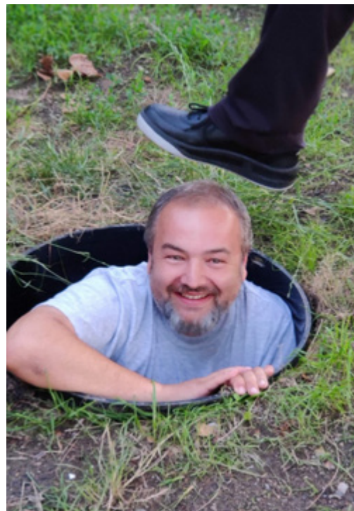
Pan správce se musí snažit!

Se zvoláním Malvaňáku zdar a Učku též! RW