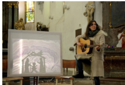
foto z programu Vánoce – příběh světla, kostel sv. Kateřiny, Velvary

V případě zájmu Vám budeme posílat aktuality. (hláste se na kontaktním e-mailu)