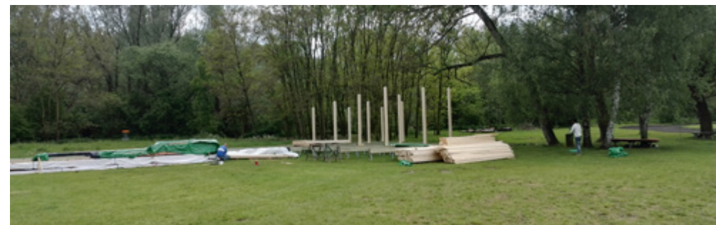
U Malvaňáku už se Učko začíná pomalu tyčit