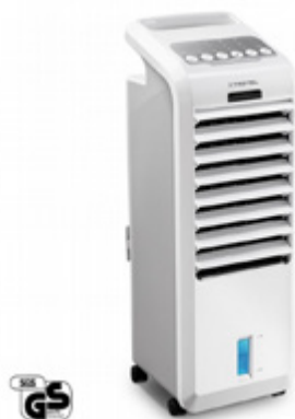
Ochlazovače vzduchu ceny od 2430,-Kč.