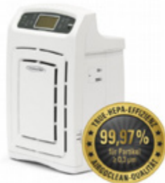
Čističky vzduchu ceny od 7300,-Kč.