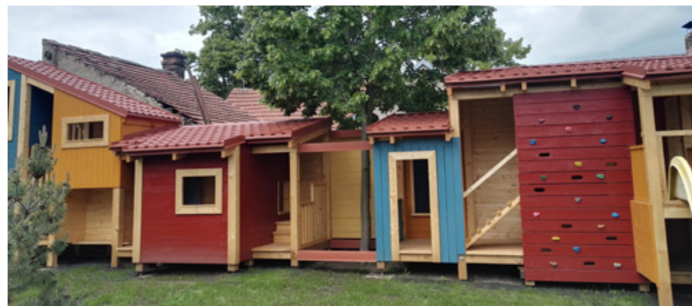
Domeček v družině předáme dětem počátkem června