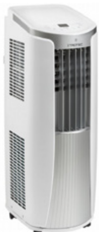
Mobilní klimatizace ceny od 8 100,-Kč.

Abyste se za každého počasí u Vás doma cítili příjemně. Naše firma dodá vše až k Vám domů. Výrobek na přání vybalíme, pomůžeme uvést do provozu, vysvětlíme obsluhu. Vše pro Vaši spokojenost.