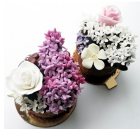
Letos šefíky kvetly opravdu sladce