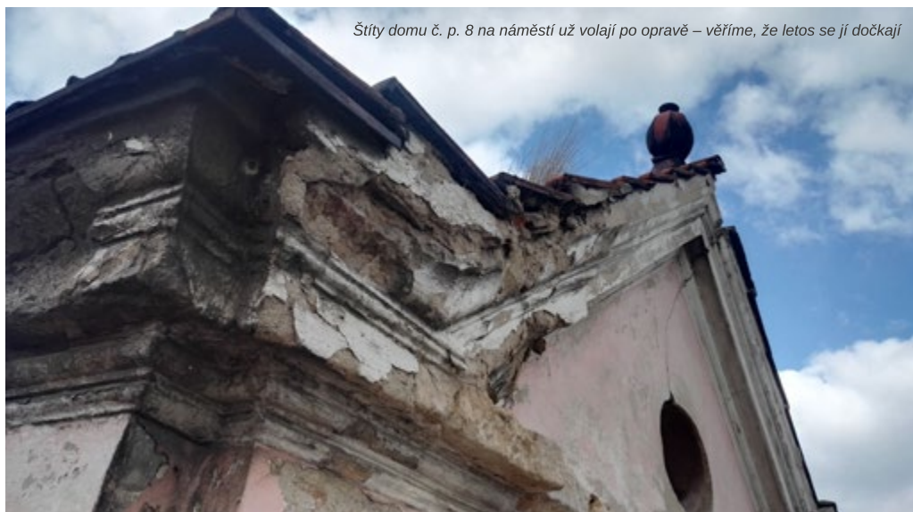
Štítý domu č. p. 8 na náměstí už volají po opravě – věříme, že letos se jí dočkají

Jistě jste si všimli, že město začalo být v poslední době více pomalované různými nápisy. Radost nám to nedělá, protože se jedná o nápisy nepěkné, nápisy na soukromém majetku a nápisy splňující podstatu trestného činu sprejství. Ty vážnější jsme předali pro řešení státní policii a jejich autoři se omluvili a přislíbili nápravu. Mrzí nás ale, že jejich příklad – možná z nerozumu – opakují mladší. Pro město není problém díky kamerovému systému vypátrat, kdo je autorem kterého nápisu a začít autory stíhat. Chceme tomuto ale předejít, protože víme, že jde o nezletilé, kterým by stíhání udělalo velké problémy v budoucnu. Prosíme rodiče, aby s dětmi promluvili a vysvětlili jim, že i drobný nápis fixou může znamenat velký a zbytečný problém.