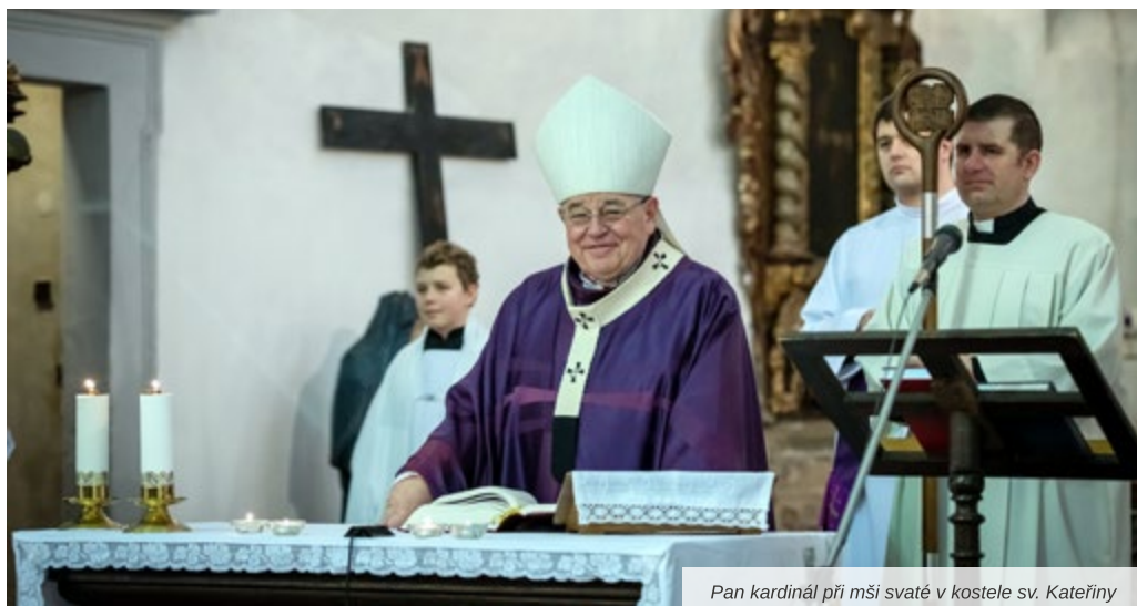
Pan kardinál při mši svaté v kostele sv. Kateřiny

Povídání u kávy a koláčků bylo milé a přátelské a velmi nás potěšilo, že pan kardinál nevyloučil možnost znovuoživení velvarské farnosti, které by pro naše město bylo velkým přínosem a návratem k více než 700leté tradici.