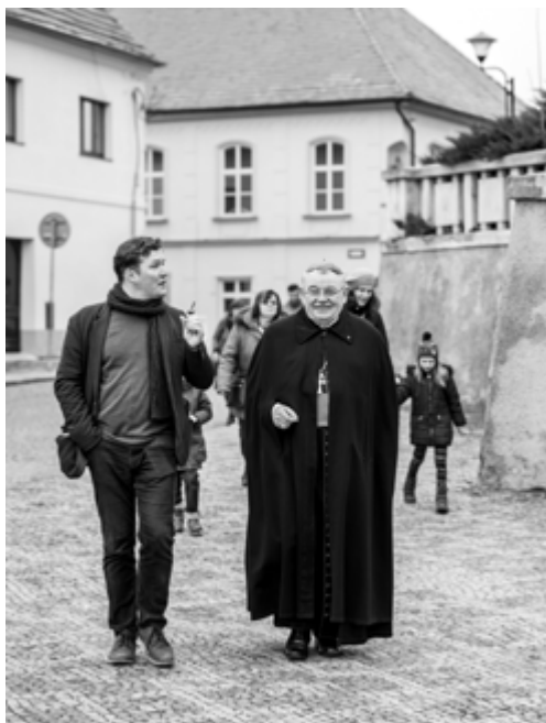
Při krátké procházce městem došla řeč i na společnou péči o církevní objekty