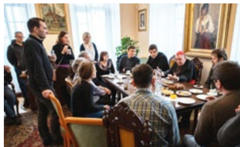
Při povídání na radnici se pan kardinál rozhovořil i o svém spoluvězeňství s Václavem Havlem