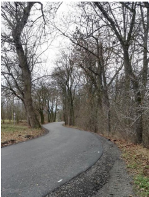
Opravená cesta do Nabdína je pěkným dárkem od správy a údržby silnic.

vod a přestrojení dvou přečerpávacích stanic, restaurování branky v Chržínské ulici, oprava jižní části hřbitovní zdi a obnova kapličky po palladiu, zbudování velké vyhlídky na Radoviči, oprava chodníků v Ješíně, pořízení multikáry pro technickou četbu a mnoho a mnoho dalších menších investičních akcí. Získali jsme pro všechny, kdo měli zájem, kvalitní kompostéry zdarma, pořídili štěpkovač, instalovali jsme nový rozhlas, máme nový digitální povodňový plán... stihlo se toho na jeden rok fůra, řekl bych. Něco se začalo a dokončí se na jaře – nové hřiště v Ješíně, úprava prostranství před ZUŠ, vitráže v kostele sv. Jiří, zasíťování parcel u Horova mlýna, věřme, že i obnova nádrže na Velké Bučině, kterou jsme museli reklamovat.