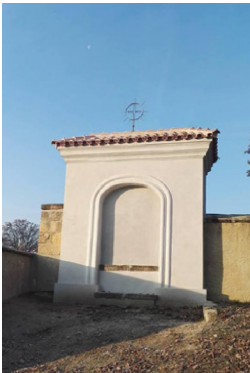
Opravená kaplička se těší na budoucí výmalbu.