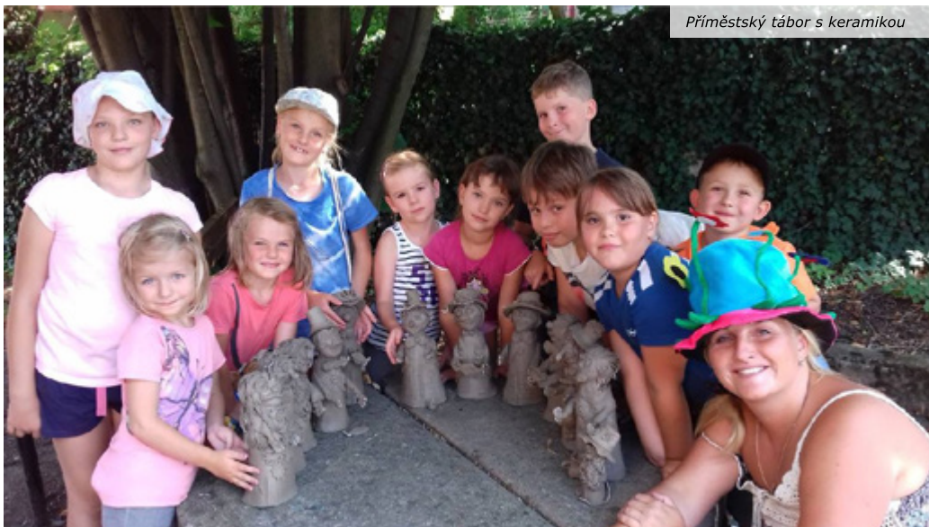
Příměstský tábor s keramikou

ní pro děti 3 – 5 let se Zuzkou Michalíkovou, večery pro ženy s Andreou Levovou, nový formát pravidelných měsíčních setkávání Celoroční konstelační program s Janou Najmanovou.