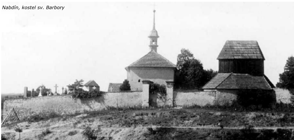
Nabdín, kostel sv. Barbory

Prohloubení studny na obec. hřibově. Na prohloubení studny byly podány dvě na-