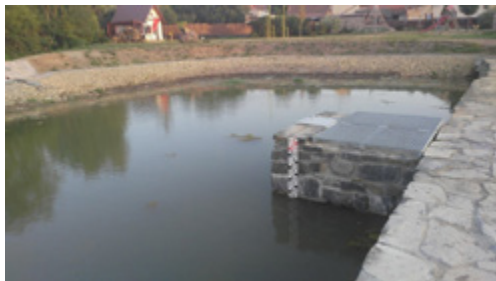
Nádrž na Bučině se napouští pomalu, ale jistě, každý stupeň se počítá

To Malvaňák se zas zazelenal až moc. Dlouhodobá vedra zasáhla plně i naši milou plovárnu, které to udělalo tak špatně, až z toho chudinka zezelenala celá, takže jsme se od poloviny prázdnin mohli koupat leda ve svém potu. Inu, není to žádná horská bystřina, zelená byla i voda v potoce a náhon téměř netekl, tak se není co divit. Bohužel teploty sužovaly i citlivější ryby, některé až z toho vedra začaly lekat.