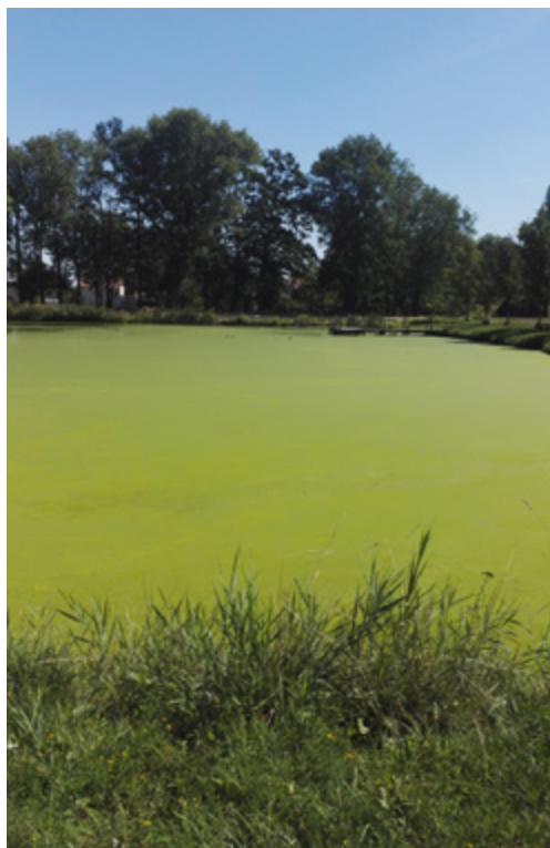
Malvaňák po vlně sucha a veder připomínal spíše hřiště pro kachny