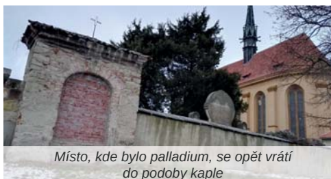
Místo, kde bylo palladium, se opět vrtá do podoby kaple