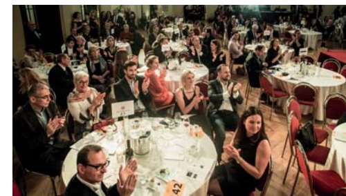
A dárce jsme nadchli, protože se během několika minut vybralo skvělých 633 tisíc. Jsme rádi, že jsme mohli pomoci v tom, aby projekt Místo, kde žijeme, pomáhal i jinde.