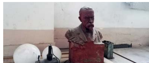
4. Třeba busta TGM, náš tatíček prezident, nalezený pod jevištěm, bude jistě vykonávat bedlivý stavební dozor.