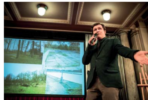
Během pár minut jsme vylíčili, co vše jsme v rámci projektu udělali, a jak jedeme dál.