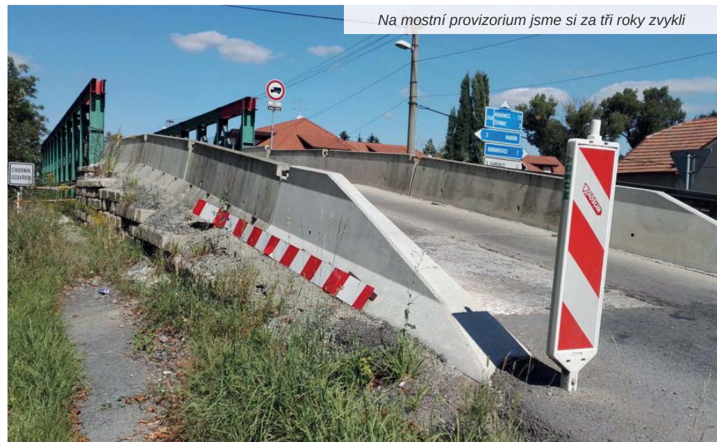
Na mostní provizorium jsme si za tři roky zvykli

Z opravy pro nás vyplývá několik zásadních věcí. Nejdůležitější je omezení dopravy i pěších. Stavba bude mít navržené dopravní značení, které bude upozorňovat blížící se řidiče na uzavírku, ale i tak