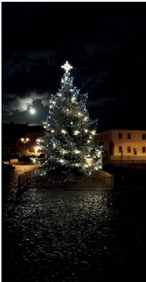
Stromeček byl obzvláště krásný