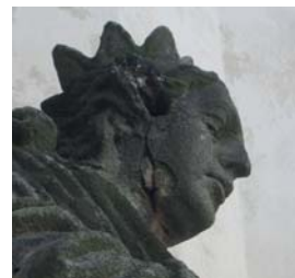
Svatá Kateřina sice zdálky nevypadá špatně, bližší pohled však napoví, že je třeba rychle zasáhnout

opravu sochy sv. Kateřiny, která hledí na náměstí od východního průčelí kostela. Každý z projektů byl podpořen částkou 98.000,- Kč. Dále jsme uspěli v programu na zřízení míst odpočinku v krajině, kde jsme získali finance na vybudování třetí vyhlídky na Radoviči, ta by tentokrát měla být bytelnější, se schody a s lavicemi a stolem, čili bude více působit jako rozhledna. Dalším projektem je Lavice vzpomínek a plánů u Malovarského rybníka, která už je i hotova a slouží nejen k posezení, ale i jako vstupní plakátovací plocha při vstupu do areálu. Dotační podpora nás těší, ač se jedná o drobné projekty, přispějí ke zkrášlení města, realizaci projektů začneme připravovat hnedle z kraje nového roku. A hnedle podáme i nové žádosti na další akce, díky za případné náměty (podrobnosti dotačního titulu na stránkách SZIF). Další dotační podporu – tentokrát od Ministerstva obrany – jsme získali na opravu válečných hrobů, jejich obnovu bychom rádi zvládli do výročí založení republiky.