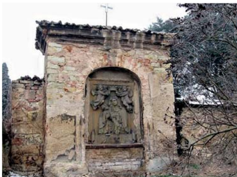
Palladium před sejmutím, ještě na hřbitově

V závěru roku jsme získali dobrou zprávu z Ministerstva zemědělství, kde jsme počátkem minulého roku požádali o podporu několika projektových záměrů, které by přispěly ke zvelebení našeho města. V rámci programu na podporu drobných památek (jedná se o hřbitovní zdi, kapličky a křížky), z něhož jsme loni obnovili křížek na Velké Bučině, jsme letos získali prostředky na další opravy hřbitovní zdi, na opravu kapličky po palladiu a na