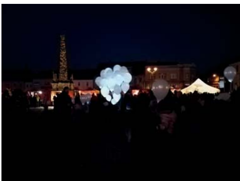
O světélka tajných přání byl velký zájem