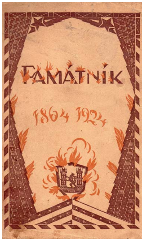
Hasiči – jubilejní památník, 1924