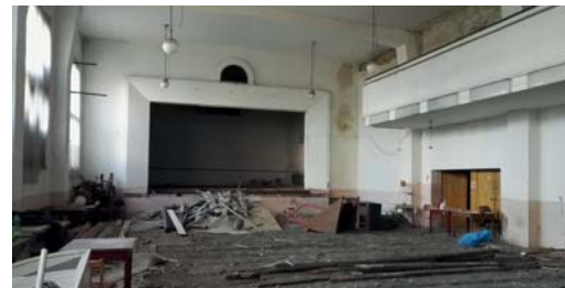
1. Na sále se v současné době odstraňují staré povrchy.

Kontakt : Věra Mikezová , mob.: 777 020 148