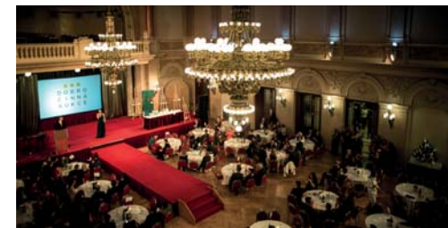
Aukce se konala v reprezentativních prostorách pražského Žofína - nadace Via zde každoročně přivítá mnoho štedrých dárců.