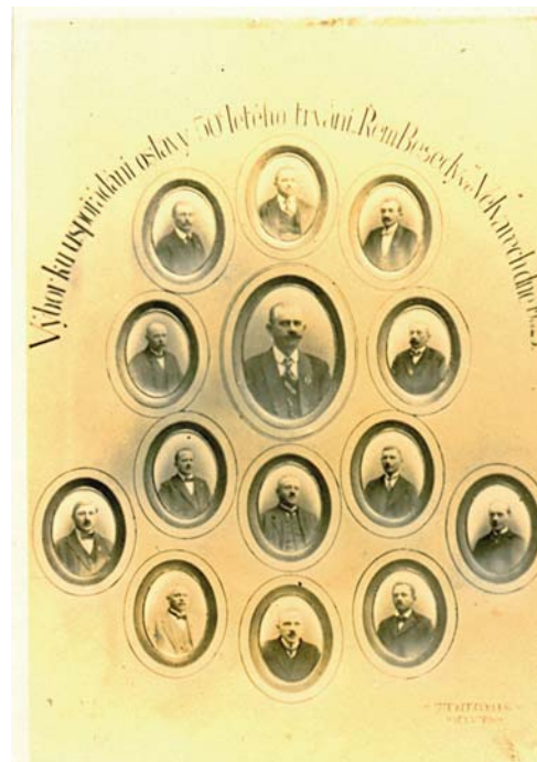
Řemeslnická beseda, 1923