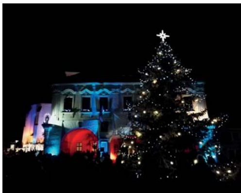
Radnice opět hrála všemi barvami