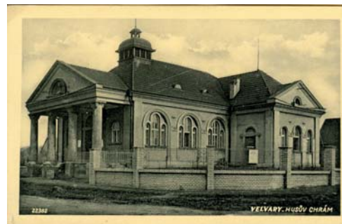
Husův chrám, 1924 a Husův chrám a stavba Spořilova, 20. léta 20. století