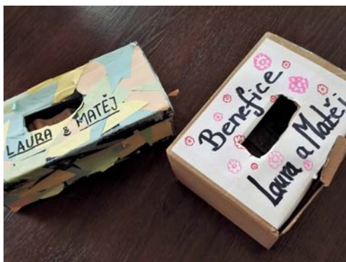
A krásně zaplnily benefiční krabičky