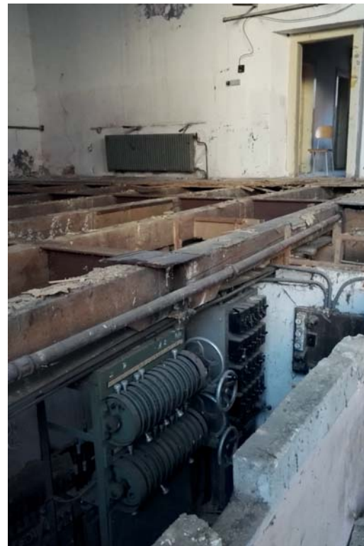
3. Okrytí povrchu potvrdilo, že bude třeba celková výměna, alespoň se ukázaly zajímavé dobové technologie i nečekané poklady.