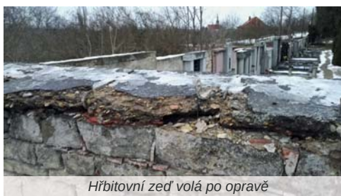
Hřbitovní zeď volá po opravě

opravu sochy sv. Kateřiny, která hledí na náměstí od východního průčelí kostela. Každý z projektů byl podpořen částkou 98.000,- Kč. Dále jsme uspěli v programu na zřízení míst odpočinku v krajině, kde jsme získali finance na vybudování třetí vyhlídky na Radoviči, ta by tentokrát měla být bytelnější, se schody a s lavicemi a stolem, čili bude více působit jako rozhledna. Dalším projektem je Lavice vzpomínek a plánů u Malovarského rybníka, která už je i hotova a slouží nejen k posezení, ale i jako vstupní plakátovací plocha při vstupu do areálu. Dotační podpora nás těší, ač se jedná o drobné projekty, přispějí ke zkrášlení města, realizaci projektů začneme připravovat hnedle z kraje nového roku. A hnedle podáme i nové žádosti na další akce, díky za případné náměty (podrobnosti dotačního titulu na stránkách SZIF). Další dotační podporu – tentokrát od Ministerstva obrany – jsme získali na opravu válečných hrobů, jejich obnovu bychom rádi zvládli do výročí založení republiky.