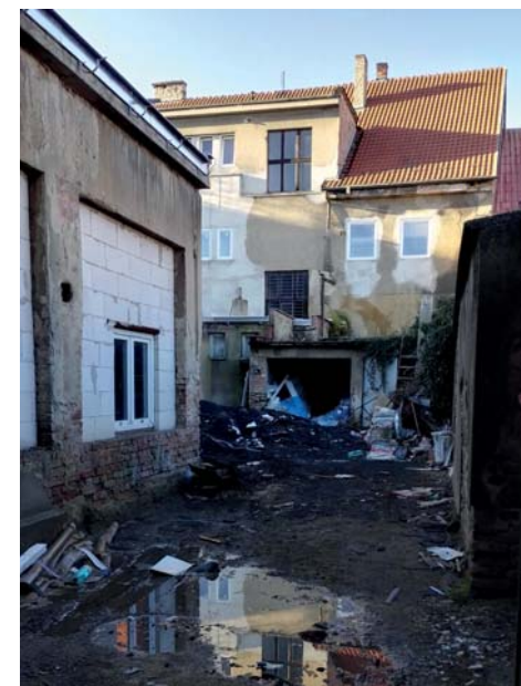
5. Na dvoře u sálu by mělo být jednou pěkné posezení, chce to ale nadšený přístup.