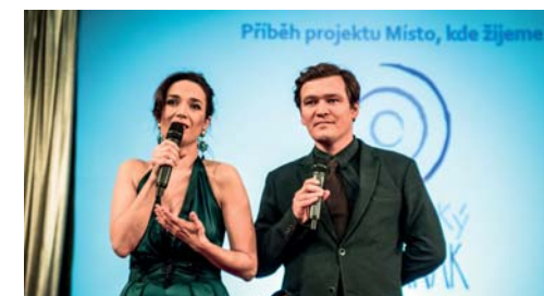
Pak bylo třeba vybrat na další podporu projektu Místo, kde žijeme. Promluvili jsme tedy o Malvaňáku.