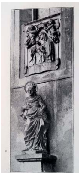
271. Velvary, Relief P. Marie a socha sv. Kateřiny vých. průčelí děk. kostela.