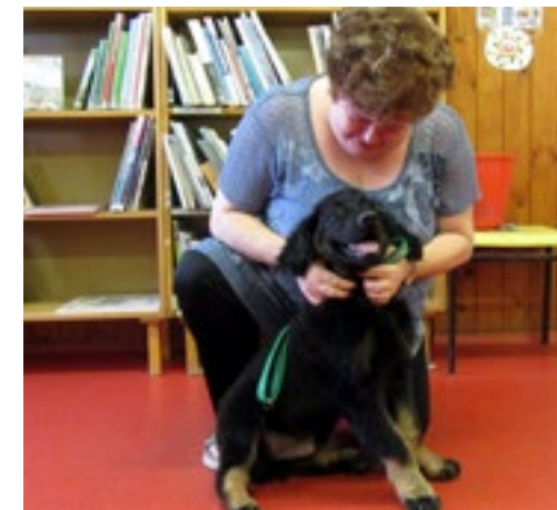
Někteří návštěvníci naší knihovny jsou opravdu netradiční, ale přivítáme je u nás stejně rády jako ty, kdo umí číst.