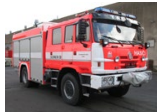
ilustrační foto obdobné cisterny CAS 20