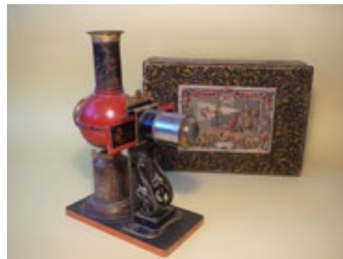
Laterna magica, E. PLANK Nürnberg, 1875–1885