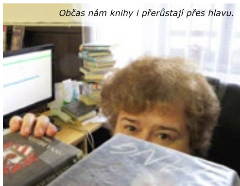
Občas nám knihy i přerůstají přes hlavu.