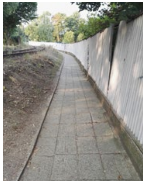
Chodníček od nádraží brzy nebude stezkou chodecké zručnosti nebo se říká znoznosti?

infrastruktury na chodníky v Malovarské ulici a v ulicích Za Roudnickou branou a U Cukrováru. Společnost MT Comax též přislíbila opravu chodníčku podél trati od nádraží. To se bude chodit!