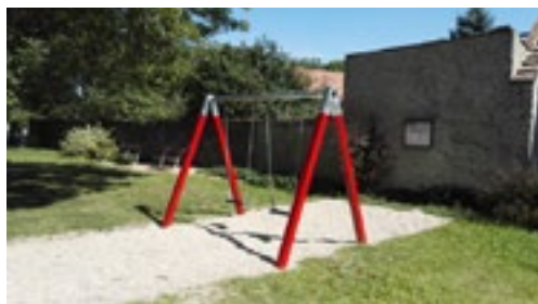
Nové houpačky za Panskou hospodu.

U hané. Noví Uhané mají nové hřiště, ať jim dobře slouží, nové houpačky byly přidány i do parku za Panskou hospodu. Máte-li návrhy na další doplnění něčeho někam, sem s nimi!