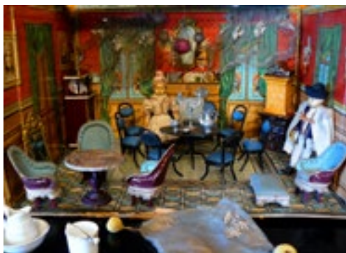
Pokojíček pro panenky, stavebnice v papírové krabici, Rakousko-Uhersko, kolem roku 1880

V minulosti existovalo mnohem více hraček, než si dnes dokážeme představit. Věděli byste, jak vypadaly a fungovaly například staré