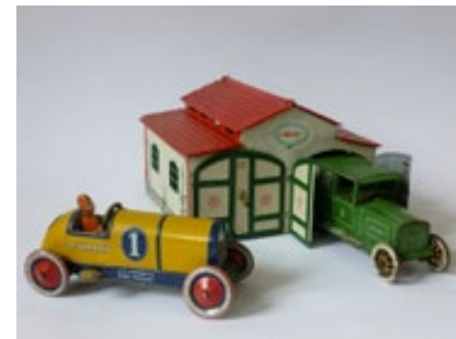
Garáž s autem typu Sedan a závodní bugatti, E. P. LEHMANN Brandenburg, 30. léta 20. století

Není to zase tak dlouho, co jsem si jako malý chlapec hrával s kamarády v létě o prázdninách, svoje oblíbené hračky mám dodnes pečlivě uschované a některé jsem si také sám vyráběl. Na své dětství moc rád vzpomínám. Zrovna nedávno jsem potkal na chodníku dvě holčičky, mohlo jim být asi tak nanejvýš deset let. Nešlo si nevšimnout, že byly oblečené a nalíčené jako dospělé slečny. Nesly s sebou mobilní telefon a poslouchaly jaký si blíže neurčitý styl hudby. Viditelně měly dlouhou chvíli a nevěděly, co dělat. A to byl ten lepší případ. Bylo mi jich líto. Jakoby dnes děti zapoměly si spolu hrát, dětskou představivost a fantazii nahradil internet, dětské hry a říkadla patří již do minulosti. I přesto je v současné době možné objevit v hračkářských obchodech některé tak zvané retro hračky, kdy se několik českých výrobců rozhodlo obnovit starou výrobu hraček sedmdesátých a osmdesátých let.