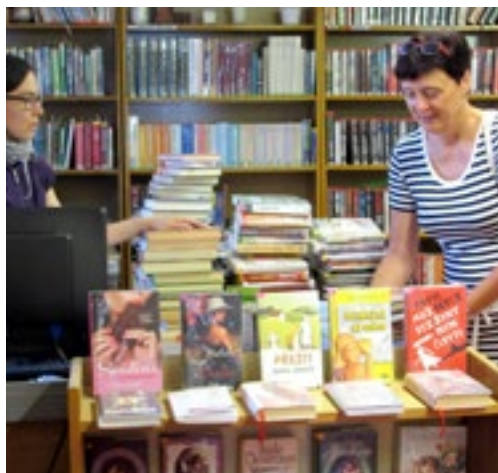
Hlavní je, že jsou čtenáři spokojeni a v horkých srpnových dnech využijí knihovnu i pro chvíli oddechu.