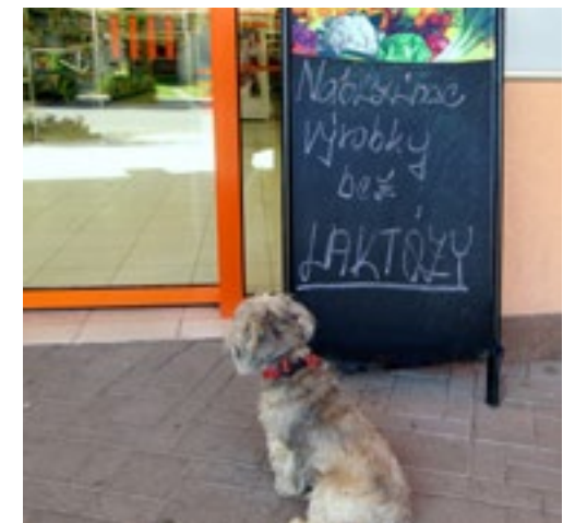
Jak vidno, tato zpráva nezaujala jen lidské zákazníky. Že by se tvořila fronta na bezlaktózové buřtíky?

Laktózová intolerance je částečná nebo úplná neschopnost trávicího traktu zpracovávat laktózu - tedy mléčný cukr. Postižení jedinci mají nedostatek enzymu laktázy a jsou nuceni vynechat ze stravy mléko a mléčné výrobky. Je přitom jedno, jestli jsou mléčné výrobky vyrobeny z kravského mléka, nebo z mléka jiných zvířat. Laktóza je přirozenou součástí všech mlék včetně lidského, takže v tomto případě neplatí, že např. ovčí či kozí mléko lidem s alergií na laktózu nevadí. Snížená snášenlivost laktózy se až na výjimky objevuje v dospělosti (může nás potkat v jakémkoli věku) a v současnosti se s ní potýká opravdu hodně lidí. Dietní omezení jim dovedou velmi znepríjemnit život. Jedním z dobrých řešení jsou bezlaktózové výrobky.