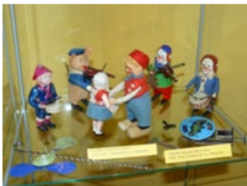
Tančující postavičky SCHUCO na hodinový strojek, Schreyer & Co., Německo, 30. léta 20. století