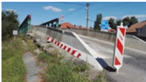
Že by ti, kteří říkali, že tu provizorium budeme mít pět let, neměli pravdu, a měli jsme jej tu jen roky čtyři?

a my vyzvíme, co, kdy a jak se přesně bude dít. Dáme neprodleně vědět! Budeme jednat o podobě budoucího dopravního řešení (i když už se ví, že kamiony opět budou moci jezdit), budeme se snažit, aby uzavírka trvala co nejkratší dobu. Kdyby do malty byla potřeba vejce, okamžitě navaříme. Anebo dodáme borovičku.