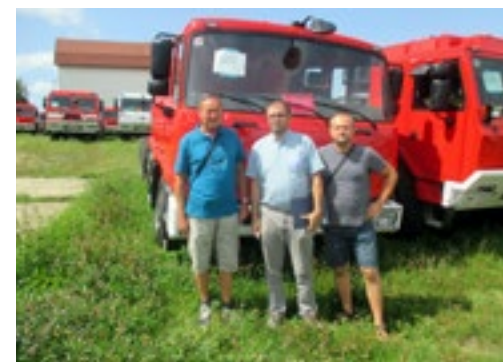
naši hasiči před podvozkem, určeným pro město Velvary