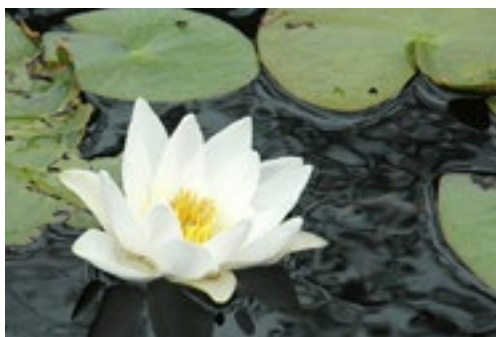
Už jen leknín nás dělí od zahájení prací na Velké Bučině

B učina. Velkou Bučinu čeká velká oprava dlouho nečištěné nádrže. Výběrové řízení je za námi, zakázku vyhrála firma AQUASYS ze Žďáru nad Sázavou. Peníze z dotace přislíbeny. Na vodní hladině však pluje vzácný leknín, nyní probíhá papírové kolečko, abychom jej směli opatrně vyjmout a zas vrátit. Až budeme mít schváleno, jde se na to! V příštím čísle představíme přesný průběh prací. Aby do opravené nádrže neprýšřtěly splašky a leknín nám neovadal, upravujeme opět projektovou dokumentaci kanalizace a stále se snažíme o dotaci. 27 milionů je hodně, ale zatím se nevzdáváme! Sen Pavlu i Vašků: Bučina bez splašků!