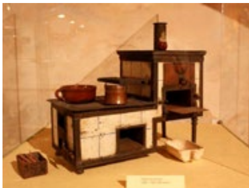
Dětský sporáček, Německo, 1880-1900