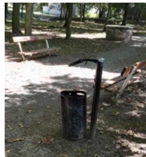
V parku za školkou je to však s posezením horší, tady řádil někdo bez rozumu...

M ost. Prý už bude!!! Zprávu, kterou vyslala média, potvrdil i krajský investiční technik. Výběrové řízení ukončeno, stavbu bude provádět slovenská firma Doprastav. Náklady jsou necelých 17 milionů, investorem je Kraj, který velkou část hradí z prostředků EU, hovoří se o tom, že se má začít na jaře. V průběhu září má být podepsána smlouva a následně jsme domluvili jednání, kde se sejdou všichni zúčastnění,