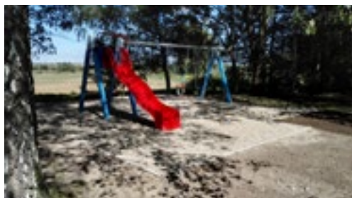
Nové hřiště na Nových Uhách vzniká za přispění místních, tak se rodí rychle.