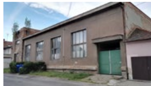
Záložna zatím tiše čeká, ale je vidět, že se u toho trochu usmívá, protože si ještě před nedávnem myslela, že se nedočká nikdy.

X dalších věcí se nám ve městě děje, a ještě víc by se dít mohlo, „kdyby byli lidi“. Pokud máte o městské dění zájem, nebo se na něm chcete podílet, dejte