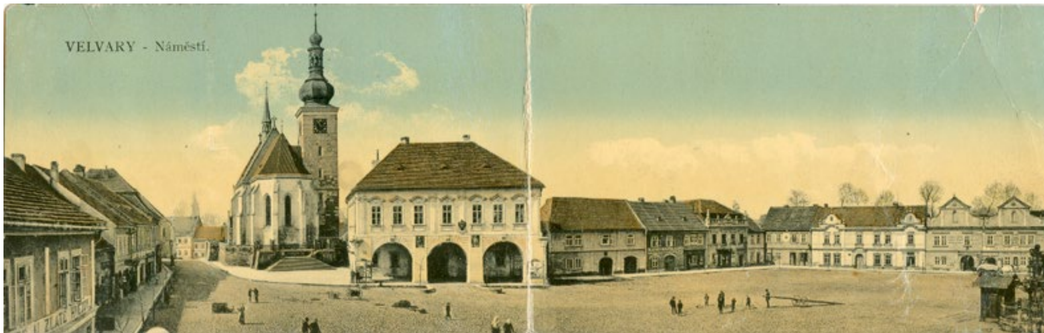
VELVARY - Náměstí.