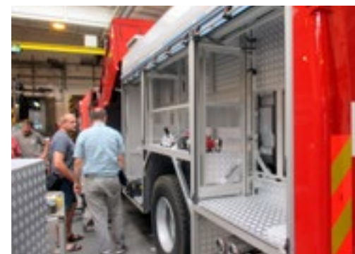
prohlídka výrobních prostor THT Polička