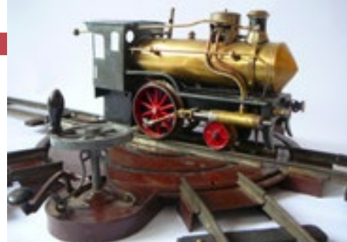
Lokomotiva na parní pohon, G. BING Nürnberg, 1900-1910