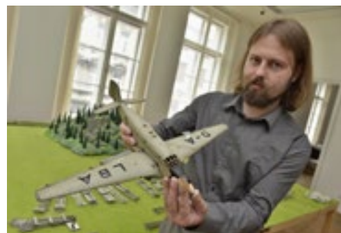
Autor článku s modelem dopravního letadla Wehrmachtu typu Junkers D-A LBA, MÄRKLIN Göppingen, 1938-1944

mechanické hračky? Působily někdy až bizarně, jakoby snad patřily do kabinetu fyziky mezi modely určené ke školní výuce. Objevy mechanických principů a technické vynálezy v průmyslu i dopravě inspirovaly menší podnikatele po celé 19. století k výrobě kovových mechanických hraček pro děti, a to podle skutečných vzorů současné parní železnice, vzducholodí, létajících strojů, parních lodí nebo prvních samohybných kočárů – autodrožky, jejichž vzorem byly skutečné hybostroje na parní pohon a na konci 19. století i první automobily se spalovacím motorem. Nechyběly ani zmenšené modely dobových průmyslových strojů a továren na parní pohon, lokomobil, parních válců nebo nejružnější typy stavebnic s obrázkovými návody. Z kovových dílů spojovaných pomocí šroubků a matic si mladí konstruktéři mohli sestavit například ocelový most, jeřáb, větrný mlýn nebo horskou lanovou dráhu. Elektrostavebnice umožňovaly dětem zapojit si jednoduchý telefon,