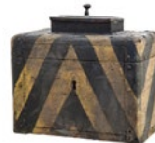
Poštovní schránka Velvary – 60. léta 20. stol.