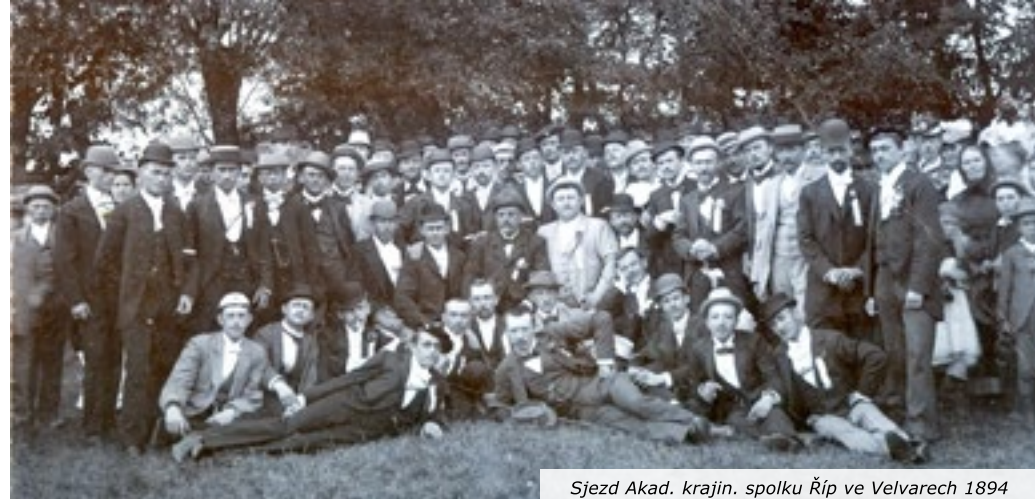
Sjezd Akad. krajin. spolku Říp ve Velvarech 1894

Při zmínce o vynikajících rodáčích velvarských musím zde poznamenati, že jsem zjistil též rodné domy obou slavných skladatelů Koželuhů, kteří byli bratřenci a ne, jak v jich životopisech se uvádí,