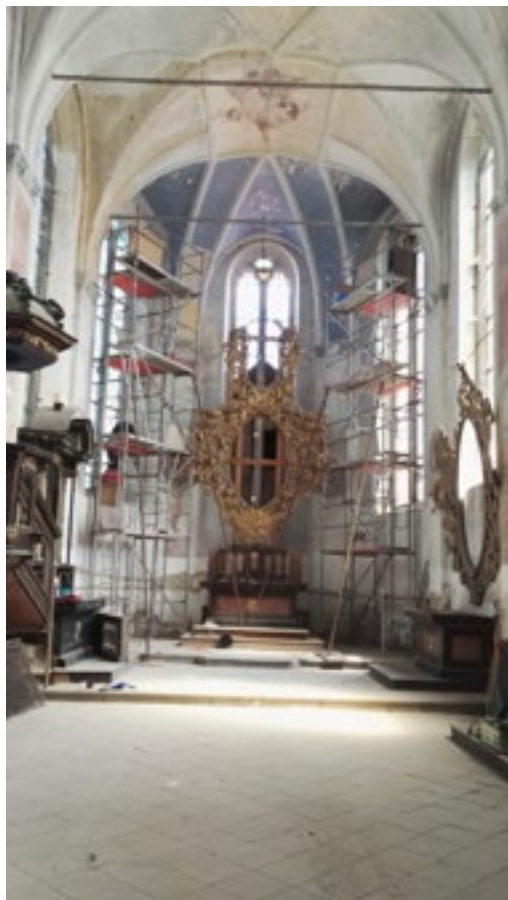
Pohled do kostela sv. Jiří při snímání vitráží