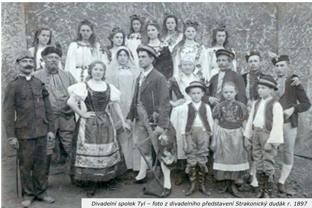
Divadelní spolek Tyl – foto z divadelního představení Strakonický dudák r. 1897

Vznik a život ostatních četných spolků velvarek nebudu vyličovat, zmíním se jen ještě, že r. 1884 založena byla jednota sokolská, jež domohla se v r. 1920 koncesse ku zřízení biografu, jehož činnost byla zahájena 1. 4. 1921 v sále domu Rolnické záložny č. 224. V roce 1923 o Nový rok přesídlil biograf do vlastní rozsáhlé budovy vedle školy. Budova pro biograf jest první náběh k zřízení samostatné Sokolovny ve Velvarech. Biograf má ve Velvarech mnoho přátel i nepřátel, ale ať se pohlíží na jeho činnosti jakkoliv, nemůže ani nepřítel popřít, že pro život malého města, jako jsou Velvary, společensky a politicky rozšířené má velký význam a pro „Sokol“ jest zdrojem značných příjmů, bez kterých by se tento spolek nikdy nedomohl samostatné budovy. Sokol cvičí nyní dosud v tělocvičně ve škole. Před zřízením tělocvičny školní měl vlastní tělocvičnu v sále hostince u města Paříže č. 9 v I. poschodí v zadním traktu, kde jsou dnes soukromé byty.