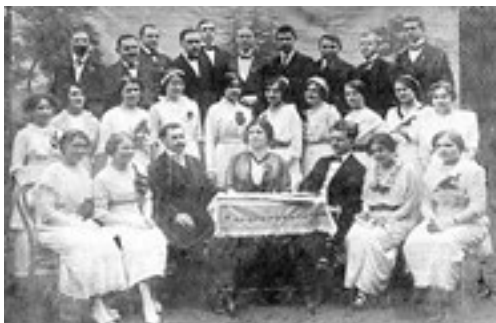
Hlahol 5. 4. 1914