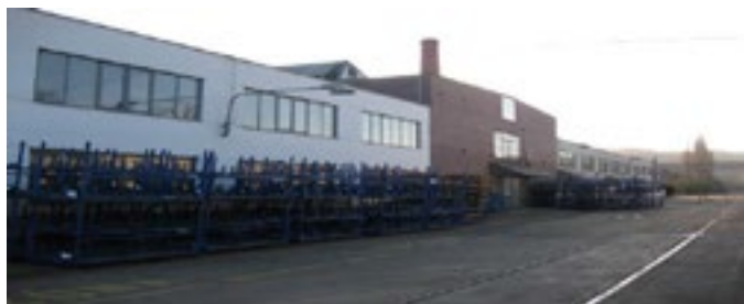
Koever CZ - Libčice nad Vltavou – Česká republika s tradicí od roku 2006