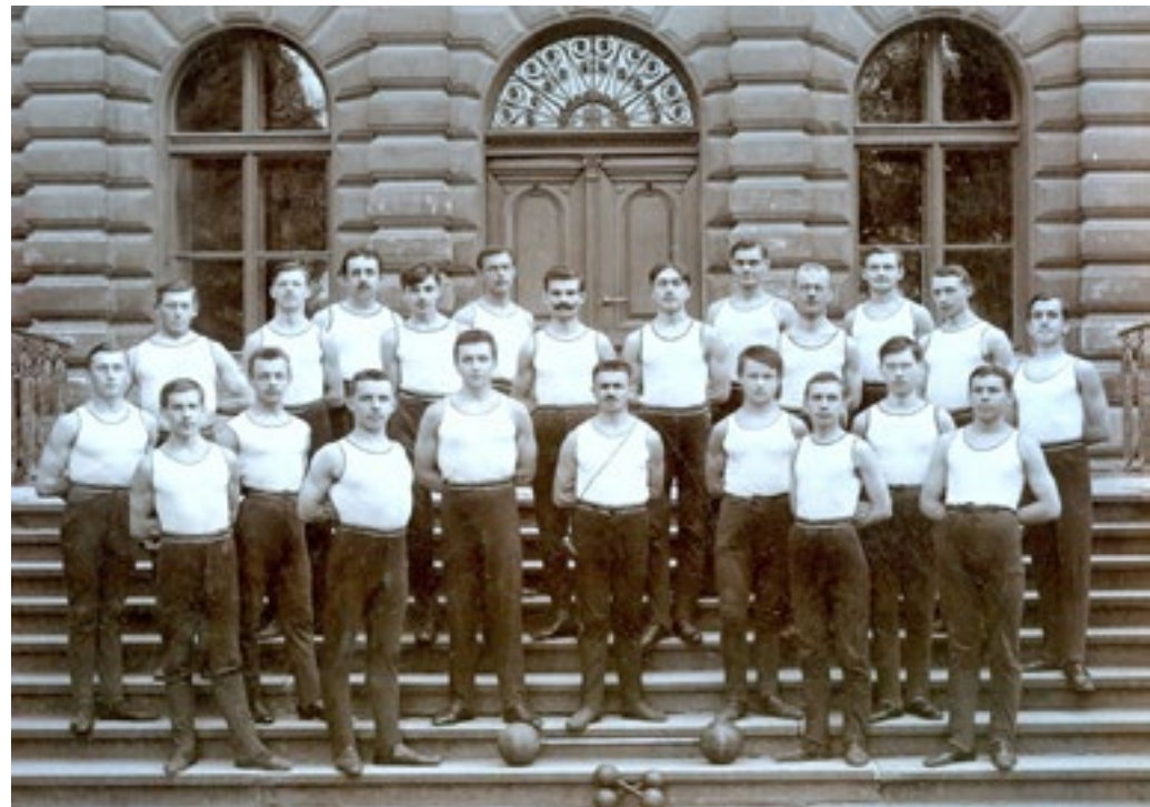
Cvičící členstvo 1912

kteří měl velkolepý průběh a veliký čistý výtěžek. Poněvadž však řeči na slavnosti promluvené zabočily někde do politiky a v roce 1884 zase foukal ostrý vítr z Vídně do Čech, byl spolek Říp rozpuštěn. Upomínka na tento sjezd dosud nachází se v četných rodinách v podobě úhledné knížečky „album pohledů z Velvar a okolí“, jež bylo při té příležitosti vydáno.