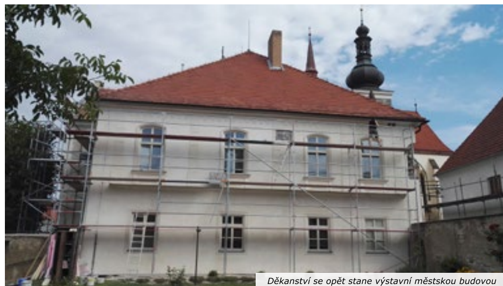
Děkanství se opět stane výstavní městskou budovou

architektonického dědictví, ze svého přidáme jen 300 tisíc. Uvidíme, zda se to povede i za rok. Do kostela jsme již zatím pozvali i restaurátora maleb, který potvrdil naši domněnku, že pod bílým nátěrem se skrývá ojediněle zachovalá renesanční výmalba. Je tedy zřejmé, že i po dokončení oken budeme mít co dělat.