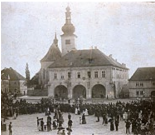
Slavnost 25 let sboru dobrovolných hasičů Velvary – zajímavostí jsou určitě hasiči šplhající po střeše radnice

z důvodu, že odmítl kardinál posvětit základní kameny k Národnímu divadlu. Uvádím to jako doklad, jak názory se časem mění. Dnes kdyby arcibiskup chtěl takové svěcení provést, nikdo by na ně nerefletoval. Sbor dobrovolných hasičů založený r. 1864, slavil v roce 1924 své šedesátileté jubileum, při které to příležitosti vydal obšírný památník. R. 1871 založena dnes již zaniklá „Občanská beseda“ a r. 1872 „Řemeslnická beseda“, kteráž dosud i při velkém dnes počtu různých spolků a tím na tak malém městě panující roztržičnosti, má svůj význam a pěknou knihovnu. Spolek vojenských vysloužilců, založený r. 1879 a dnes přeměněný v podpůrný spolek „Karel Havlíček“, pořídil si krátce po svém založení pohřební vůz, první toho druhu vůbec artikl ve Velvarech. Do té doby byly mrtvolky nošeny.