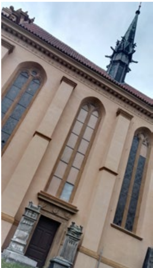
Některá okna sv. Jiří jsou již na prázdninách ve vizážistické dílně ve Svoru

...A TŘEBA VÁM TO UTEKLO, PROTOŽE JSTE BYLI JINDE