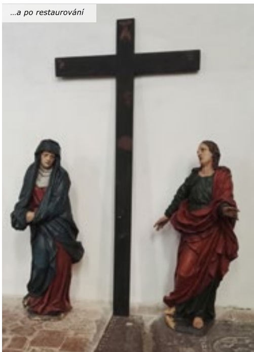
...a po restaurování

Díky všem, kteří přispěli k obnově soch, a díky také všem, kteří se přišli podívat. A pokud byste chtěli přijít za rok, zapíšte si do kalendáře pátek 25. května 2018. Kostely se opět na jednu noc otevrou pro ty, kteří se potřebují aspoň na chvíli zastavit.