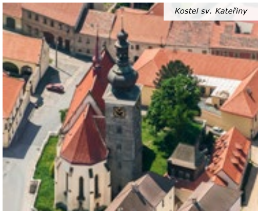
Kostel sv. Kateřiny

Na jednu noc v roce se už tradičně v naší zemi otevírají kostely i pro ty, kteří do nich obvykle nechodí. Také letos se 9. června otevřely kostely a modlitebny a navíc dva speciální svatostánky se zajímavým programem pro návštěvníky – jeden na pontonovém mostě v Praze a druhý pojízdný, v brněnské tramvaji, „šalině“, která křižovala městem.