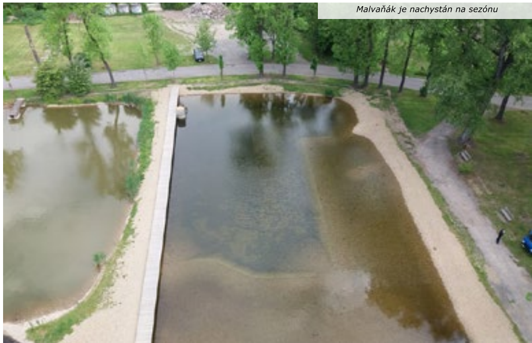
Malvaňák je nachystán na sezónu

kultury), s opravou kuchyně školní jídelny a s celkovou opravou chodníků v Ješíně (obě z vlastní kapsy), chystají se další opravy a práce, které se budou