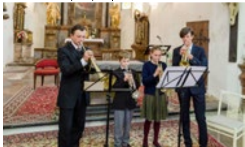
Závěrečný koncert ZUŠ v kostele sv. Kateřiny

A v červnu nebude lépe. Vrcholí školní rok a je tu čas závěrečných vystoupení a všelikých slavností,