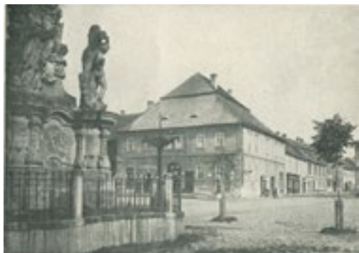
Reduta – bývalý Dryáčnickovský dům

sepsal MUDr. Rudolf Čermák (doslovný přepis bez úprav)