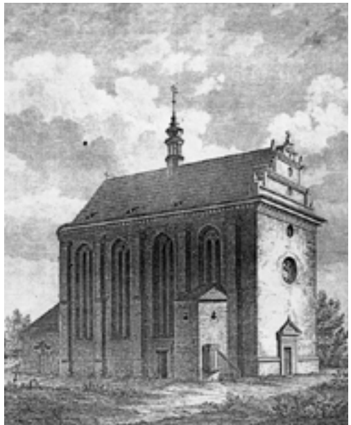
Kostel sv. Jiří - památky archeologické r. 1862

k výšce kostela příliš velká, porušila značně harmonii pohledu na tento kostel; chrličie vody vížku tuto ještě více znetvořující. Pohled na kostel sv. Jiří zachován jest v „Památkách archeologických a místopisných“ z r. 1862 a na něm jest viděti, jak symetrickou, pěknou vížku měl dřívě.