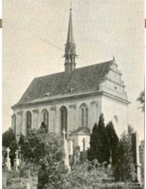
Kostel sv. Jiří, soupis památek Velv