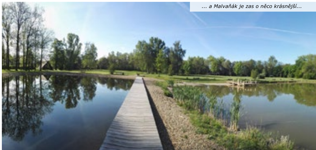
... a Malvaňák je zas o něco krásnější...