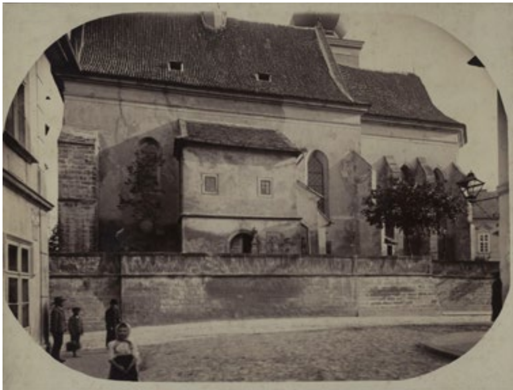
Kostel sv. Kateřiny před opravami, asi kolem roku 1900

I na sakristii byla podobná malá vížka, jež při opravě r. 1888 byla úplně odstraněna. Za mých dětských let stávala ještě při severní straně kostela na hřbitově kamenná kazatelna vzpomínka na církev podobojí, či správněji řečeno luteránskou, která kostel sv. Jiří v r. 1616 dostavěla, poslední kostel protestantský v Čechách před válkou třicetiletou, který zůstal nezbořen! Kazatelna kamenná byla zbořena r. 1878 při opravě kostela; byla chatrná, ale nebylo třeba ničit tuto starobylou památku, poněvadž ji bylo lze snadno opravit.