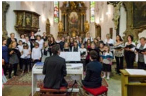
Vystoupení pěveckého sboru

Filipojakubská noc rozžehla velvarský máj a ten zaplál pestrým děním, přinesl toho mnoho, tu něco tradičního: ať již spanilý průjezd veteránů ve stopě slánského Oriona, zdařilou dědkíadu či pěkný dětský den u Malvaňáku..., tu něco nového: skvělý úspěch našich dětí na republikové taneční soutěži, postup fotbalové rezervy do přeboru a hasičů na krajskou soutěž, nebo zahájení činnosti klokaní velvarské akademie..., ve městě to žilo jako v jarním úle, rojilo se to koncerty, zábavami, výstavami a soutěžemi, koupáním v teplých dnech zas ožil i Malovarský rybník, který se nově též pyšní krásným molem vzniklým rukou nadšenců.