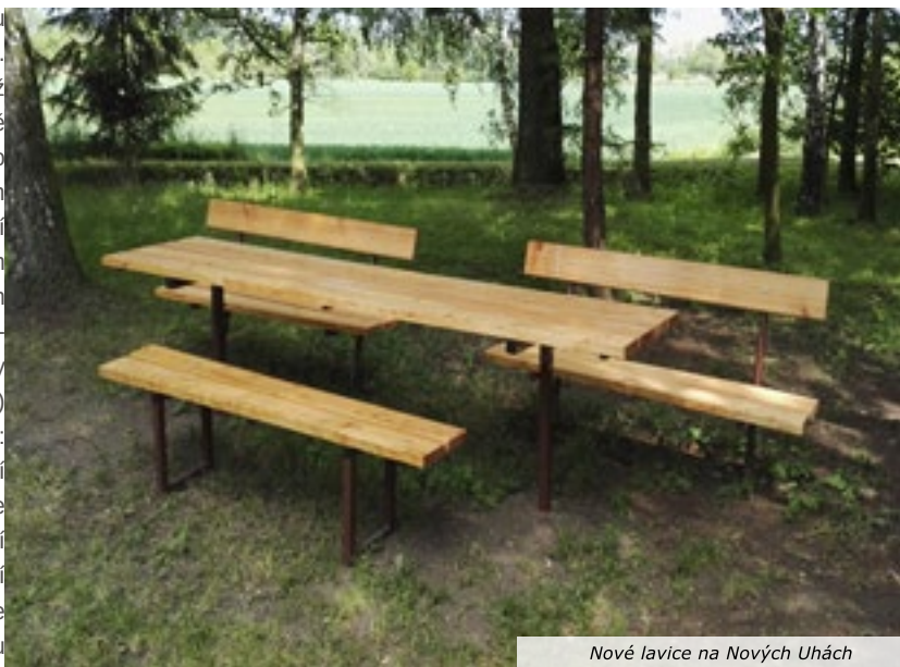
Nové lavice na Nových Uhách

pro úpravu ke zpomalení dopravy u Malovarského rybníka. Chystá se toho ještě mnohem více, bude co dělat.