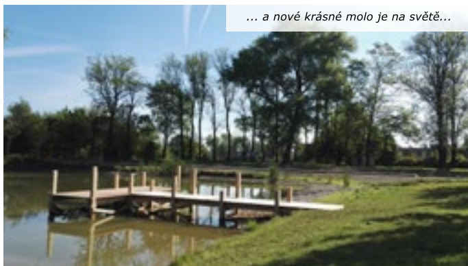
... a nové krásné molo je na světě...

Stále se snažíme sehnat dotační prostředky na výstavbu budovy U-čka, které by poskytlo potřebné zázemí. V létě budou k využití stávající toalety, nyní se pracuje na opravě pumpy, abychom mohli splachovat. Co myslíte, nebyla by tu pěkná lodička?