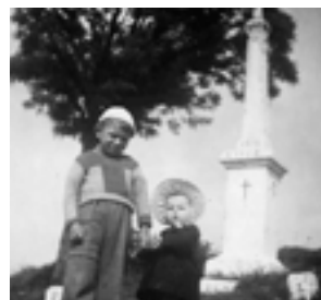
...a vrátil se do své dřívější podoby