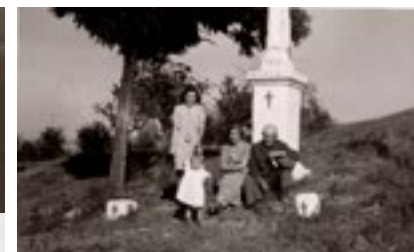
Ještě jeden historický snímek - po dějinách křížku nadále pátráme, s výsledky vás seznámíme.