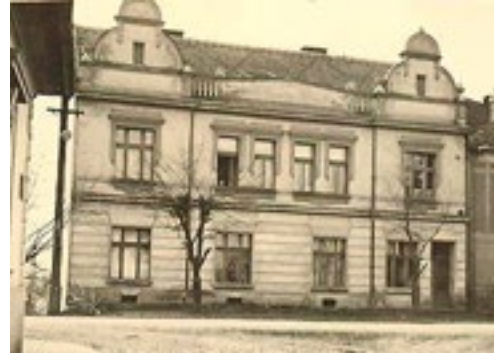
Rodný dům u Rechcíglovů ve Velvarech č. p. 326 (30. léta 20. století)

Celý svůj život měla ráda přírodu a turistiku po českých krajích. Snad nejvíce si oblíbila zpěvné ptactvo a znala i nejrůznější druhy rostlin. Učitelství považovala za své poslání. Milovala hudbu a zpěv, vždy byla veselá a v dobré náladě, a to i v těžkých chvílích. V době totalitního režimu byla pro svou katolickou víru často