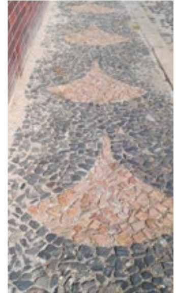
Krásné chodníky Na Brčkově