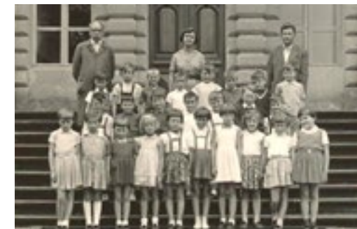
Skupinový portrét žáků I. třídy školy ve Velvarech, z doby kolem roku 1959