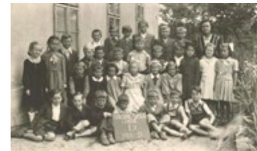
Skupinový portrét žáků I. třídy Národní školy v Chrzhíně ve šk. roce 1950–1951