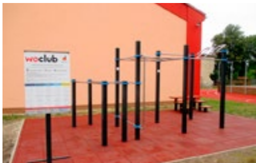
Work-outové hřiště je venkovní posilovnou, sokolové by z ní jistě měli radost

jsou mezi mladšími i staršími stále oblíbenější, proto by ani ve Velvarech nemělo jedno chybět. Na tabuli u hřiště najdete návody, jak na konstrukci cvičit i odkazy na internetovou podporu. Počátkem října proběhne na work-outu slavnostní exhibice zkušených cvičenců, kteří nám předvedou, co vše se na tom dá dělat, když to dlouho cvičíte! Přejeme všem příjemné hýbání! (rw)