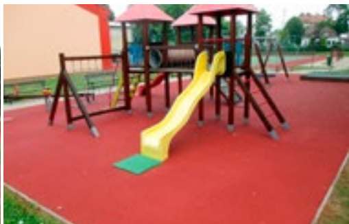
Malé i velké hřiště mají nový nástřik