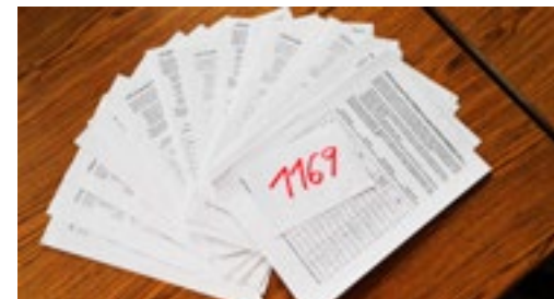
Petici podepsalo téměř 1200 lidí z Velvar a okolí

Děkujeme všem, kdo podepsali petiční archy s výzvou České spořitelně pro zachování pobočky ve Velvarech. Během krátké chvíle se sešlo 1169 podpisů lidí z Velvar i z okolí, vesměs klientů tohoto bankovního ústavu. Petici jsme odeslali do rukou ředitele Erste Group ve Vídni s německy psaným průvodním dopisem vyzývajícím vlastníka Spořitelny a nejvyšší vedení k přehodnocení svého rozhodnutí. Čekáme na odpověď.