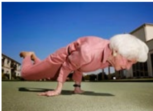
Foto z akce britského sdružení Parkour Dance, které v Londýně provozuje pouliční cvičení pro osoby nad 60 let

Město také hledá činné seniory, kteří by měli chuť pomoci s přípravou městských akcí a s podporou městského dění, hledáme osoby, které by nám chtěly pomoci v oblasti bezpečnosti, dopravy, péče o zeleň, péče o kulturní dědictví. Patříte-li mezi ty, co nemají mít ruce v klíně, ale nevědí, kam s nimi, máte hlavu otevřenou či plnou utajených plánů, určitě se zastavte na radnici na kus řeči, něco vymyslíme!!!