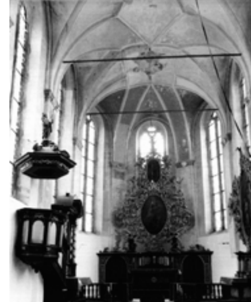
...třeba i o tom, jak kostel zevnitř sešel, takto vypadal ještě v 70. letech, je hrozné, co dokázali pustošiví vandalové. Ale my to napravíme!