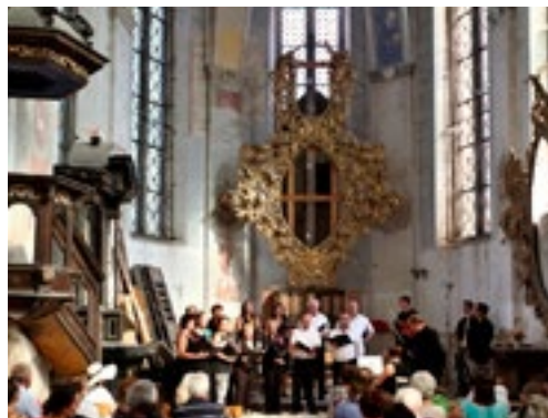
...a následoval krásný koncert, při němž bylo možno přemýšlet o budoucnosti kostela