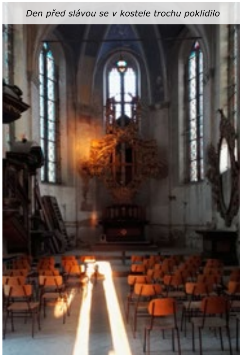
Den před slávou se v kostele trochu poklidilo

Kostel sv. Jiří – památka, kterou najdete ve všech učebnicích architektury a jejíž sláva přesahuje hranice země – letos získal nový plášť, v příštím roce bychom rádi pokračovali výměnou oken a začali se chystat na úpravy vnitřků.