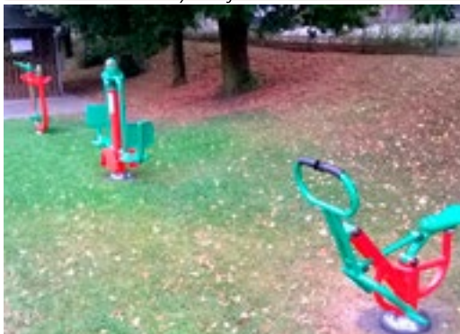
Na cvičebních strojích se lze protáhnout, zesílit i jen tak posedět...