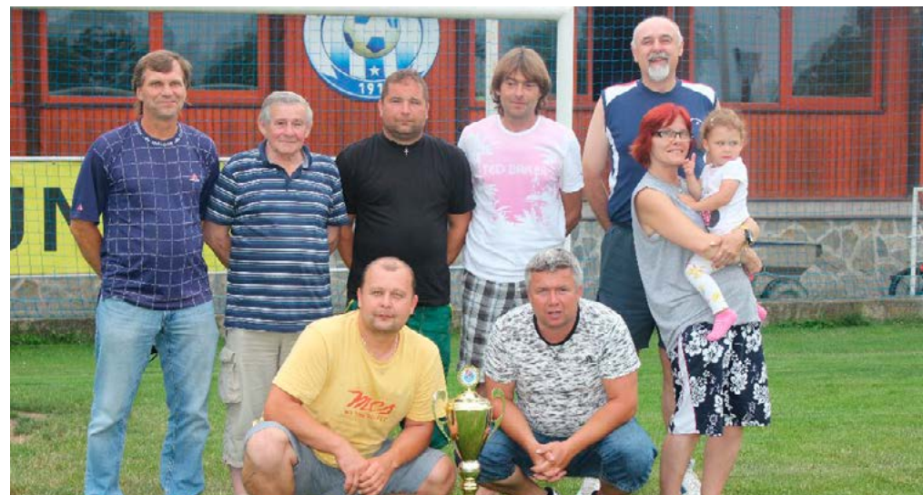
Vedení Slovanu Velvary