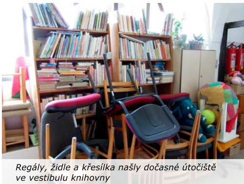
Regály, židle a křesílka naší dočasné útočiště ve vestibulu knihovny

Ve velvarské knihovně probíhají v těchto dnech práce na zlepšení interiéru. V půjčovně pro dospělé se maluje a celou knihovnu čeká pokládka nového lina. Když se v roce 2000 stěhovala knihovna z Chržínské ulice do „Panské hospody“, už zde stávající lino nějaký ten rok leželo, tak si o výměnu již dlouho říkalo.