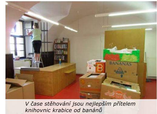
V čase stěhování jsou nejlepším přítelem knihovnic krabice od banánů

A tak vás srdečně zveme k návštěvě změněné knihovny, čeká vás větší přehlednost při výběru knih a pohodlí. Pro veřejnost bude znovu otevřeno v úterý 23. srpna.