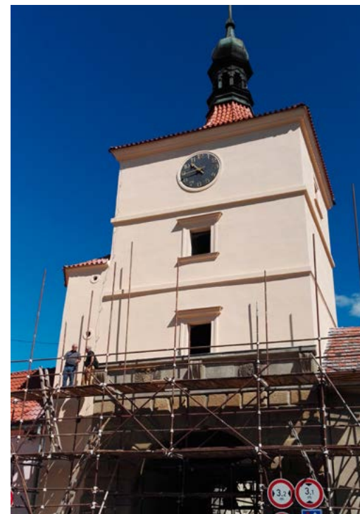
Koncem července se brána začala vylupovat z lešení a hned bylo vidět, jaká je to krásna

a sv. Václava na Bučině. Všechny tyto kroky pečlivě probíráme se zástupci památkové péče, i jim je na místě poděkovat za jejich čas a pomoc.