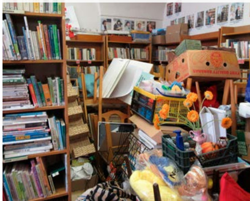
Společenskou místnost, kde probíhají besedy a další kulturní programy, by v této úpravě málokdo z diváků poznal

Pro návštěvníky dospělého oddělení bude jistě milým překvapením i odpočinkový koutek s posezením u stolečku a rozšíření půjčovny, která částečně expanduje do dosavadních prostor dětského oddělení. Dětské čtenáři však nebudou o toto místo ochuzeni. V půjčovně pohádek zrušíme dosavadní pracovní zázemí a místnost tak získá nový čtenářský prostor.