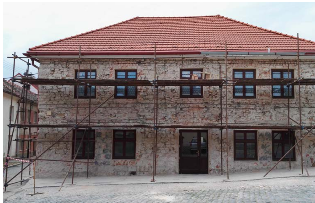
Budova ZUŠ na léto sundala kabát