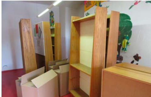
Jindy útulná dětská půjčovna teď vypadá poněkud bezútěšně

A když už je knihovna bez nábytku, rozhodly jsme se s kolegyní před jeho znovu nastěhováním i pro částečnou změnu v rozmístění regálů a pracovních míst pro uživatele internetu.