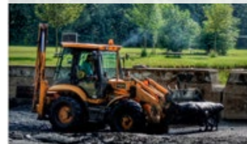
Práce na Malvaňáku - zatím bahno - brzy snad křišťálová voda!

Získali jsme dotaci od ministerstva zemědělství na opravu (či možná spíše znovuvybudování) křížku sv. Václava a sv. Vojtěcha na Velké Bučině a na zbudování dvou malých vyhlídek na vrchu Radoviči. Oba záměry je třeba uskutečnit do konce