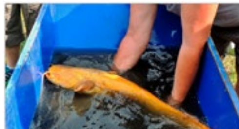
Zlatý sumec - strážce Malvaňáku - byl v bezpečí přestěhován o dům dál

Na rybníku se od výlovu čile pracuje, probíhá odtěžení sedimentu čili bahna, které se tam za léta usadilo, a jehož je žel více, než jsme čekali. Další práce budou probíhat dle projektu pana vodohospodáře Douši, pod dohledem hrázného Špičky. Dojde k převedení přítoku náhonu do větší nádrže, k vytvoření čistících zón a zavezení části rybníka šterkem. Snad práce půjdou, jak mají, a již