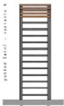
pohled železi - varianta A

Vyhlídky na Radoviči budou lehké a nenápadné, aby nenarušily ráz krajiny, ale dalo se na nich dobře posedět