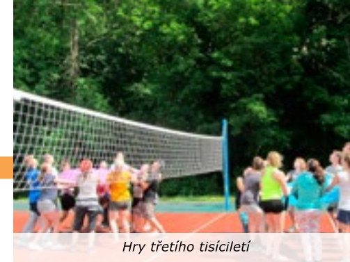
Hry třetího tisíciletí

Za Základní školu ve Velvarech si dovolují poděkovat všem , rodiči našich žáků počínaje, přes vedení města, všechny organizace a spolky až k jednotlivcům, kteří si někdy ani nepřejí být jmenováni, za pomoc a podporu při plnění a uskutečňování akcí a činností během celého školního roku. Věříme, že naše spolupráce bude pokračovat i v dalším školním roce. Přejeme vám krásné léto.