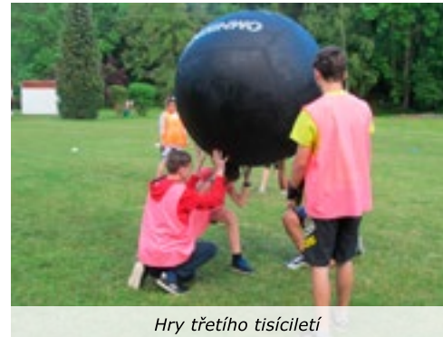
Hry třetího tisíciletí

Ještě nás čeká dopravní den, rozloučení s devátáky, rozdělení vysvědčení a hurá!!!!!! prázdniny rozpřahují svou náruč, léto budiž pochváleno. Tak se, děti, opatrujte, ať se ve zdraví v září zase sejdem! Čekají nás oslavy 130. výročí založení naší školy!