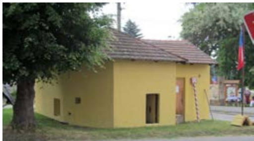
Pevnůstka „váha“ v Sazené