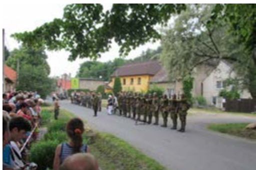
Nástup vojsk