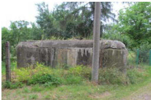
Monstrum ve Velvarech

V sousedním Německu se dostal k moci v roce 1933 Adolf Hitler. Pro Československou republiku a její vojenské činitele vyvstala nutnost řešit otázku obrany republiky. Bylo rozhodnuto vybudovat