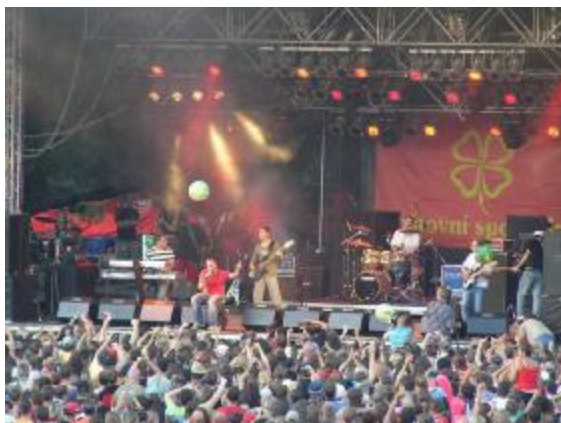
No Name na letním festivalu na Okoři 2006