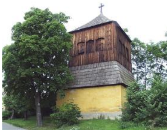
Opravy se snad dočkají i jiné zvoničky než ta řisutská

Prostředky jsou v prvních třech letech rozděleny tak, že do podpory cestovního ruchu by mělo jít 10 % peněz, do tří zbývajících po 30 %. Samozřejmě, že tento poměr můžeme po zkušenostech například z prvního roku změnit, ovšem jen se souhlasem dohlížejícího orgánu, kterým je Státní zemědělský intervenční fond.