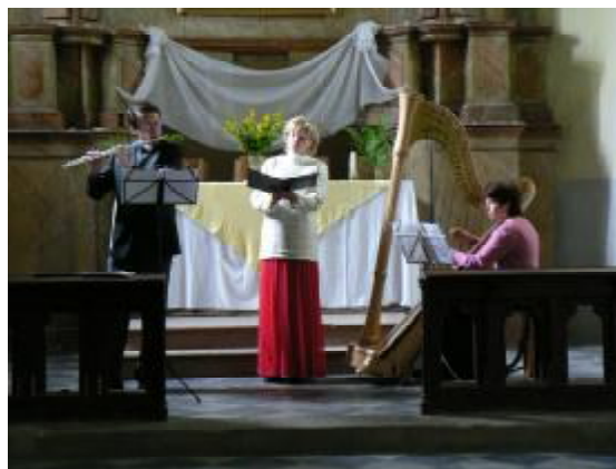
Trio Cantabile